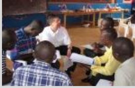
Université du Libéria

Depuis que l'UPESED a envoyé son premier bénévole en 2009, elle a terminé ou est sur le point de terminer plus de 20 projets avec dix partenaires dans onze pays : le Bénin, le Chili, l'Indonésie, l'Éthiopie (2), le Ghana (2), le Libéria (6), la Namibie (2), le Népal, le Nigeria, le Rwanda (3) et la Sierra Leone (2).