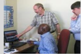
Université de la Namibie